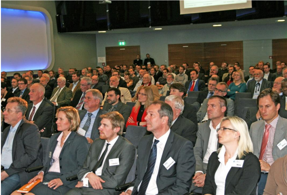
Topaktuelle Forschungsergebnisse beim Kolloquium Zement&Beton für Führungskräfte der Bauindustrie.